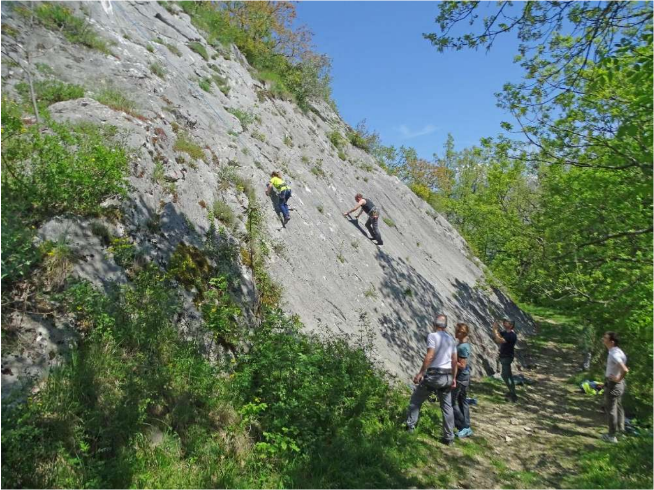
Falesia "Ratafiori" Sita sulla parte alta di Rocchetta al Volturno(IS) Le prime vie di quarto grado