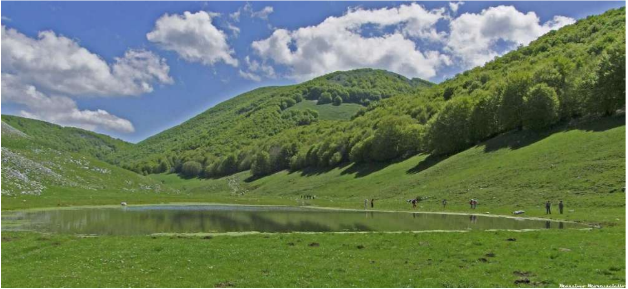
Il laghetto di Campo figliolo