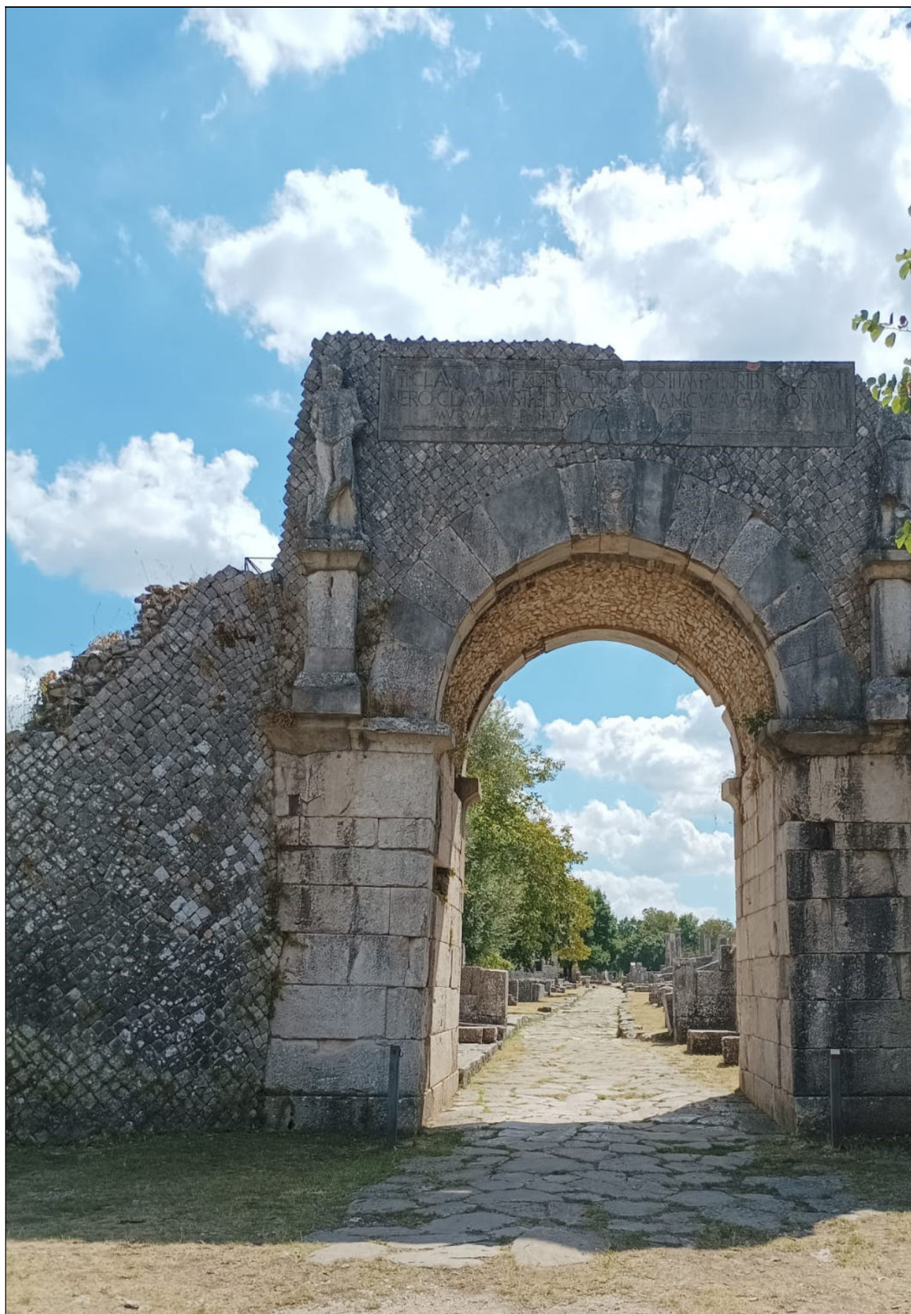
Porta BOJANO ad ALTILIA