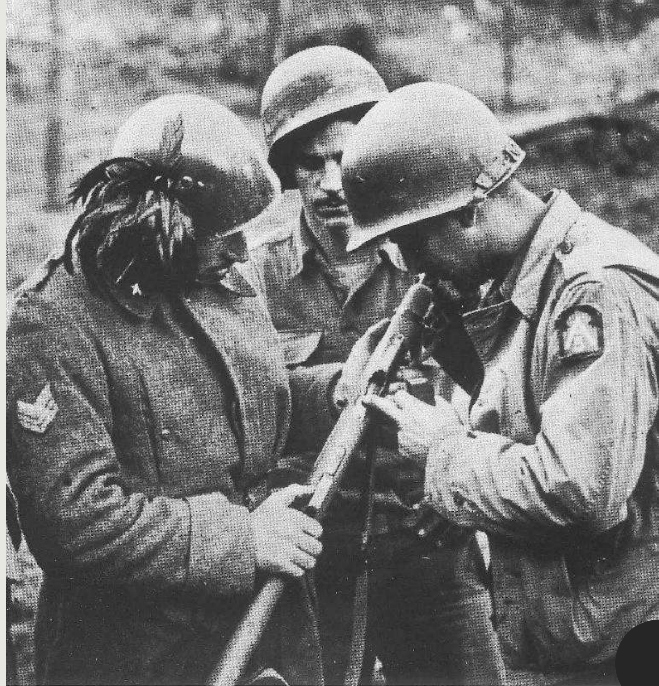
ri mostra un moschetto automatico Beretta ad un sottufficiale della 5 a Armata.