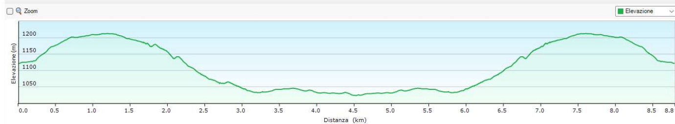
Altimetria del solo tratto sul sent. 15