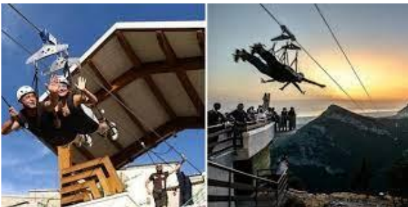
Cilento in volo