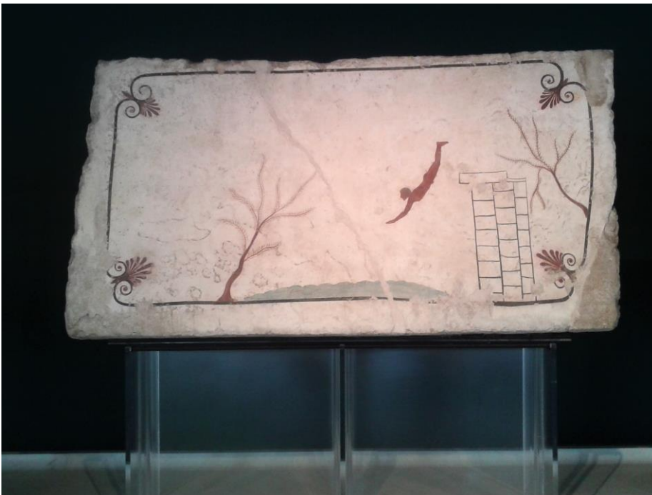
Lastra Funeraria: "IL TUFFATORE" – Museo Archeologico

Durante l'escursione, tutti gli iscritti sono tenuti ad osservare le seguenti regole di comportamento: • si fa obbligo ai partecipanti di avere con sé la mascherina e il gel disinfettante a base alcolica; • alla partenza i partecipanti saranno suddivisi in gruppi di 10 partecipanti +2 accompagnatori; • durante la marcia sarà cura degli accompagnatori mantenere durante l'escursione un debito distanziamento tra i singoli gruppi; • durante la marcia va conservata una distanza interpersonale di almeno 2 metri. Ogni qualvolta si dovesse diminuire tale distanza, durante le soste e nell'incrocio con altre persone è obbligatorio indossare la mascherina; • sono vietati scambi di attrezzatura, oggetti, cibi, bevande o altro tra i partecipanti non appartenenti allo stesso nucleo familiare.