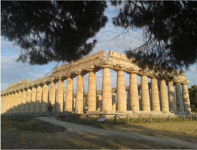
Area archeologica Paestum: Tempio