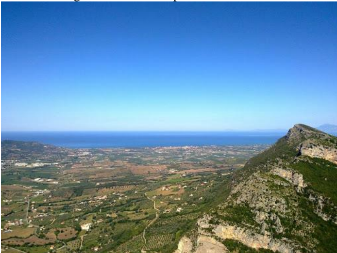
La Piana di Capaccio – Paestum vista dalla cima del Monte Vesole (1210 m.s.l.m.)